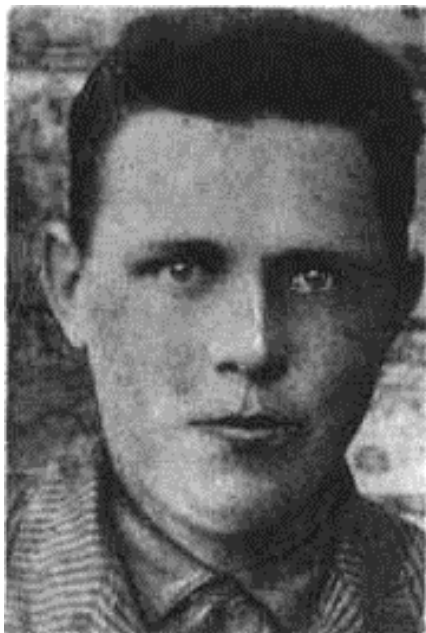
С. К. Аўдзееў

АЎДЗЕЕЎ Сцяпан Кандратавіч , н. у 1925, у Чырвонай Арміі з 1943, рад., памёр ад ран 17.11.1943, пахаваны ў в. Івоны Мсціслаўскага р-на Магілёўскай вобл.