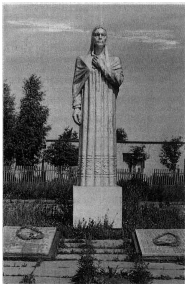
Помнік загінуўшым землякам у в. Мілейкава