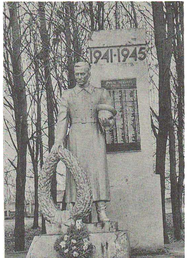
Помнік загінуўшым землякам у в. Доўгавічы