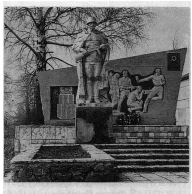
Помнік загінуўшым землякам у в. Басценавічы