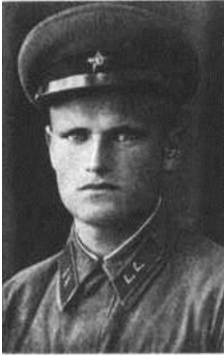
П. С. Кухараў

КАМАРОЎСКИ Міхаіл Раманавіч , н. у 1899, у Чырвонай Арміі з 1943, рад. 210-га зап. сп, памёр ад ран 21.05.1944, пахаваны ў г. Чаркасы Кіеўскай вобл. (Украіна).