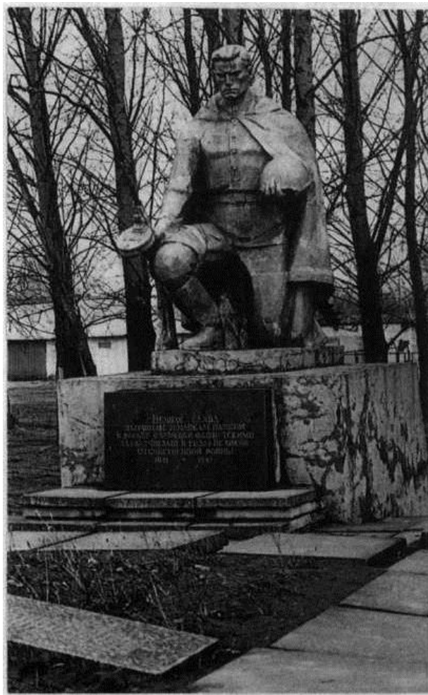
Помнік загінуўшым землякам у в. Мазалава